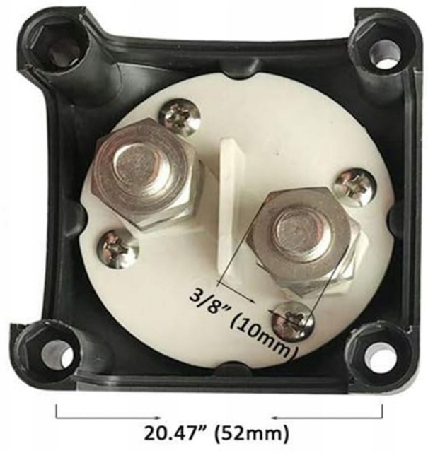
Durable ABS Plastic Housing