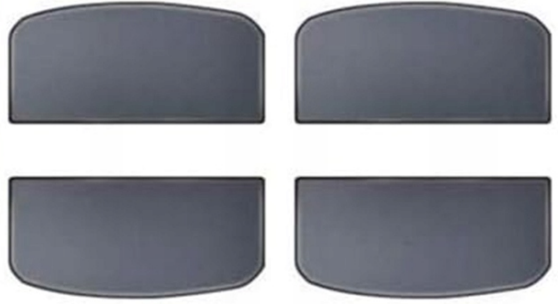
Side Pad for Dust & Waterproof